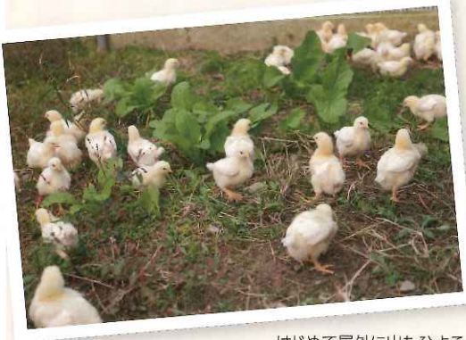
はじめて屋外に出たひよこ

令和元年7月から3つある鶏舎のうち1つをオーガニック認証に対応するように改築し、鶏が自由に行き来できる屋外スペースを設けたことでストレスフリーな環境になり、水場や餌場の高さをハンドルで調整できる仕組み等で省力化も実現した。「これからも安心安全なおいしい「神山鶏」を消費者に届けていきたい」と笑顔で話してくれた。