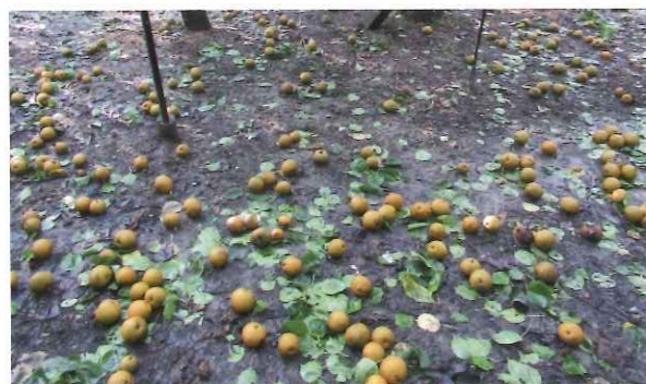
収穫直前のなしが暴風により落果

ゆずは10月23日、なしは11月6日に共済金を該当組合員さんに各丁A等預金口座へ振込支払いしました。