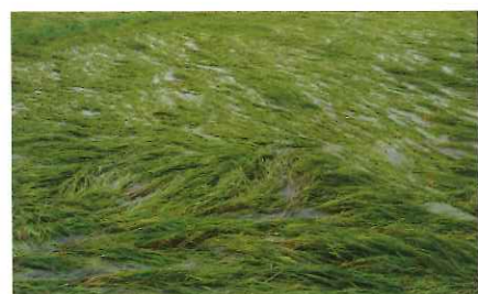
台風10号により倒伏した稲